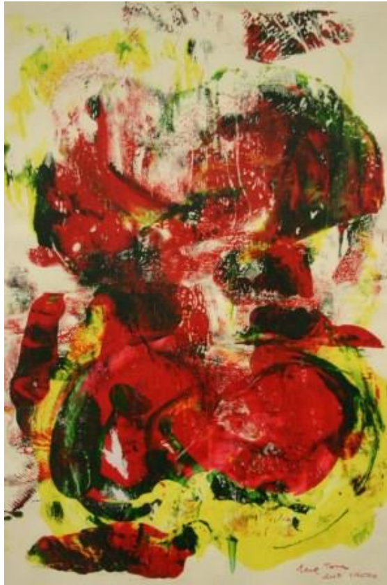
Dibujos de Raúl Torres