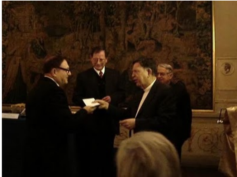
Recibiendo el premio mundial de poesía mística «Fernando Rielo»

Pero yo soy subjetivo por amistad, porque le quiero y le siento como una más de mi familia, ahora bien, mi educación severa me obliga a marcar en esta semblanza perversa la realidad en un tono objetivo cuando tengo que opinar sobre poesía, poesía selecta en su declinar, altiva en su mensaje, idílica en su contenido y maravillosa en su traza. Me encanta leer sus poemas y, sobre todo, más me encanta, compartir con él, la vida común que nos une entre afecto sincero y amistad latente y honesta. Sea, pues, para bien estas palabras.