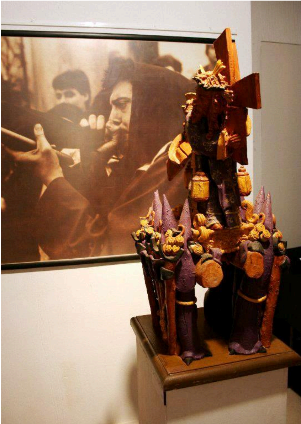
Escultura en la exposición del Museo de la Semana Santa de Cuenca, España