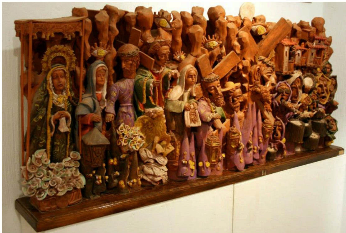
La Semana Santa