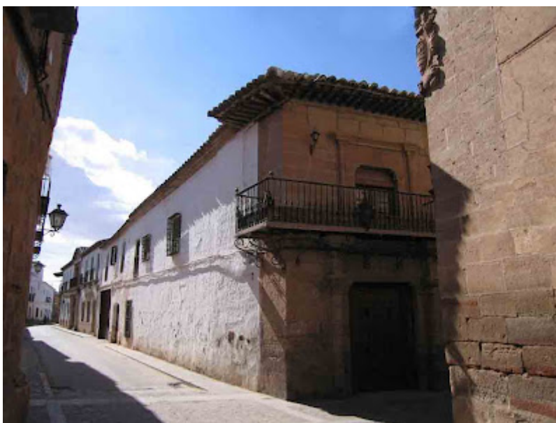
Casa del Caballero del verde Gabán , Villnueva de los Infantes en Ciudad Real