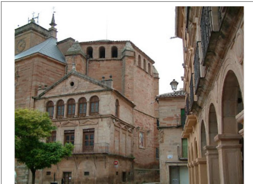
Villanueva de los Infantes (Ciudad Real)

Villa de Santiago dentro del Campo de Montiel, con sus carrascas que resisten al frío invernal, de la misma forma que al calor del verano. Entre los arroyos y olmos se cobijan las liebres y las perdices, allí siguen criando y reproduciéndose entre tanto pasar y pasar de unos a otros los pleitos y las propiedades.