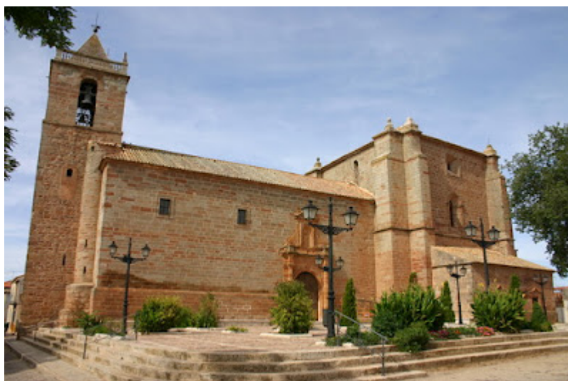
Iglesia Parroquial de Torre de Juan Abad. (Ciudad Real)

Villa de Santiago dentro del Campo de Montiel, con sus carrascas que resisten al frío invernal, de la misma forma que al calor del verano. Entre los arroyos y olmos se cobijan las liebres y las perdices, allí siguen criando y reproduciéndose entre tanto pasar y pasar de unos a otros los pleitos y las propiedades.