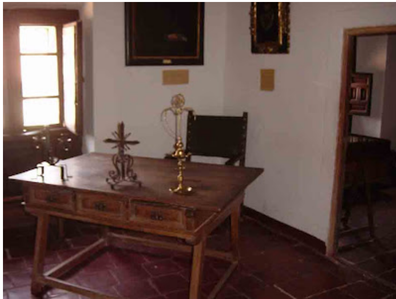
Celda de Quevedo en Villanueva de los Infantes (Ciudad real)

Poemas que incitan a pensar y a reflexionar. Eso me ocurrió hace algunos años con el poema Himno a las estrellas , profundo y actual y con otras composiciones en silva como son Túmulo de la mariposa , El sueño , El reloj de arena ... y tantos otros.