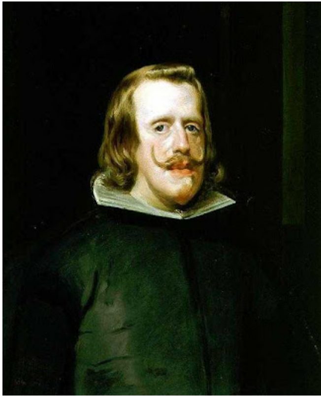
Felipe IV, Oleo de Velazquez, Museo del Prado Madrid

Vestido con una especie de gabán negro donde resalta la cruz roja de la orden de Santiago, el cuello alzado, dejando ver otro cuello blanco que da luz a su rostro, y enmarca armoniosamente su pelo largo y ondulado, junto a su bigote y perilla, cuidadosamente arreglados, nos dan una imagen del estilo irreprochable de un hombre cortesano, sin afectación, elegante y a la vez sobrio, de genio vivo y contradictorio que supo de todos los estados de ánimo.