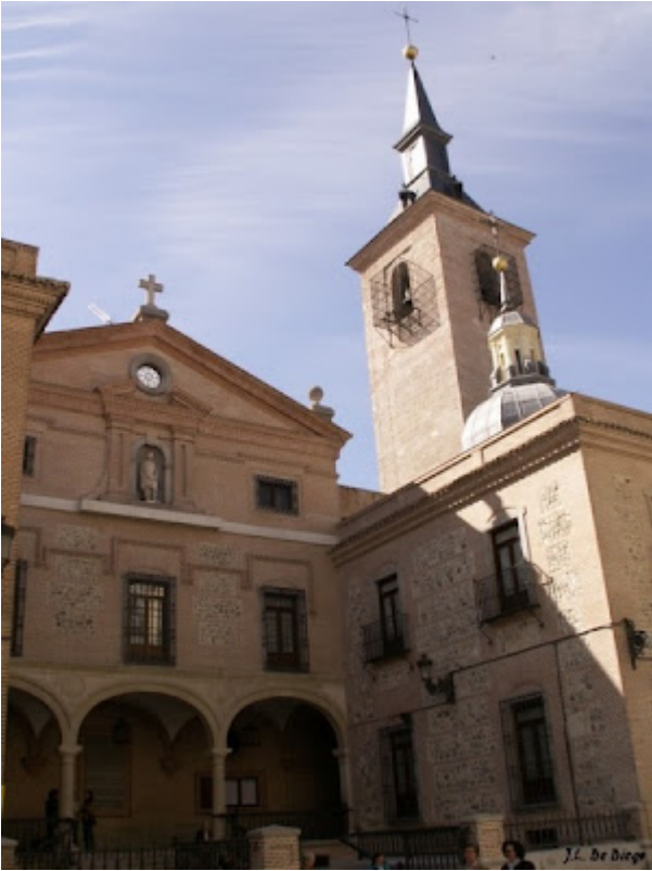
Iglesia de San Gines en Madrid

siendo testigo de hechos que reflejó en su obra literaria. Y cultivo las fuentes del saber caminando por el conocimiento de las artes y los valores humanos. Conoció el esplendor de los poderosos, sus villanías y sus bajezas. Supo que la inteligencia supera al dinero, porque aún poseyéndolo no quitan necesidad a quien lo tiene. Pero sufrió en el trajín de la vida la soledad y la derrota de los que por audaces, se atreven a desafiar a los que aún siendo necios, ostentan el poder. Fue llevado a los tribunales por sus contemporáneos acusándole de desvergonzado, vicioso, bufón, bachiller en suciedades y maligno, dejando estos hechos en su alma amargura y desconfianza en los demás. Murió con la melancolía y la tristeza en su mirada, con la serena convicción de que sólo Dios es quien hace justicia. Cerró los ojos, cuando en los Campos de Montiel se recogía la cosecha de las viñas, y se hacía en los fogones el arrope y la carne de